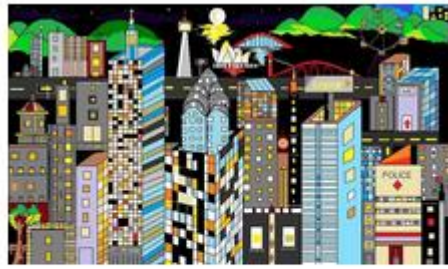
เลขที่ใบสมัคร : 5911146 นายบรรพหัตต์ โหดสงบ โรงเรียนส่งเสริมวิทยามูลนิธิ ชื่อภาพ : energy of night