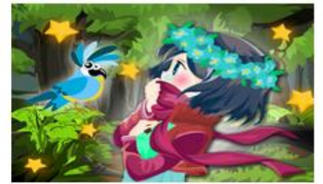
เลขที่ใบสมัคร : 5908028 นางสาวจิตภา เถรว่อง โรงเรียนตรังคริสเตียนศึกษา ชื่อภาพ : see also