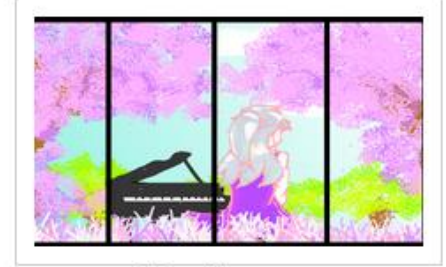
เลขที่ใบสมัคร : 5911042 นายธิตี พรหมานกุล โรงเรียนวิทยาลัยเทคโนโลยีพัฒนวิชาการหาดใหญ่ ชื่อภาพ : mucis in the garden