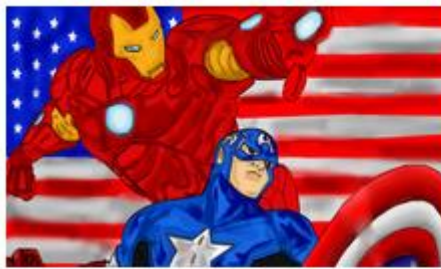
เลขที่ใบสมัคร : 5907009 นายชวิต สุขลจิต โรงเรียนศรีธรรมราชศึกษา ชื่อภาพ : ฮีโร่ในดวงใจ