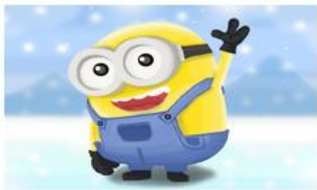
เลขที่ใบสมัคร : 5908002 นายพีรภัทร-ปริงพันธ์ โรงเรียนจ่งฮั่วโชะเซี่ยว ชื่อภาพ : snow minion